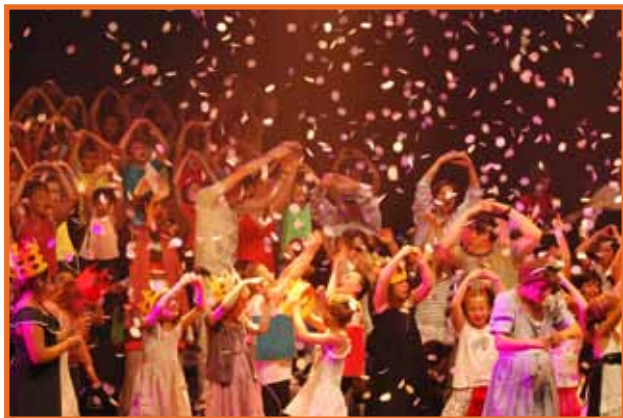
Festival Barbara - Edition 2011 - Le Soldat rose

Le festival continuera de favoriser les rencontres entre le public et les artistes interprètes, compositeurs et auteurs de la chanson française, dans des espaces conviviaux. Il reste dénicheur de jeunes talents avec son tremplin Coup de Pouce sans omettre de faire entendre ceux qui ont participé à façonner notre patrimoine musical. Cette année, le concert des Coups de Pouce sera gratuit en début de soirée pour permettre au plus grand nombre de venir découvrir les groupes sélectionnés. Nous vous avons donc concocté un programme mettant en avant la qualité du verbe et la recherche de poésie pour toutes les générations, avec un concert pertinent et impertinent du groupe Pigalle pour... les enfants !