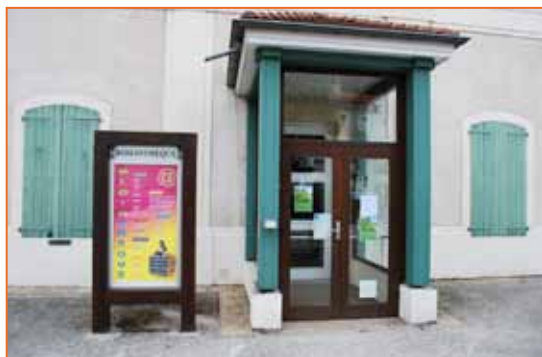
Entrée de la médiathèque