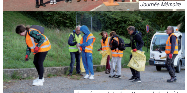
Journée mondiale de nettoyage de la planète