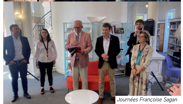
Journées Françoise Sagan