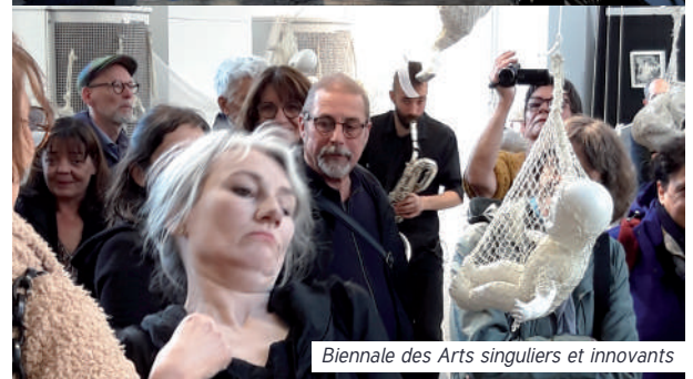
Biennale des Arts singuliers et innovants