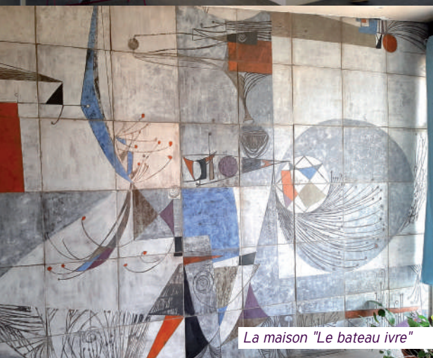
La maison "Le bateau ivre"