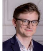
conseiller délégué à la démocratie participative

« Promesse de campagne, la participation des habitants sera l'un des fils conducteurs de l'action municipale. La crise des Gilets jaunes et l'abstention croissante ont mis en lumière la déconnexion entre les élus et les citoyens. Nous souhaitons lutter contre cette situation en intensifiant la participation des habitants aux projets communaux. »