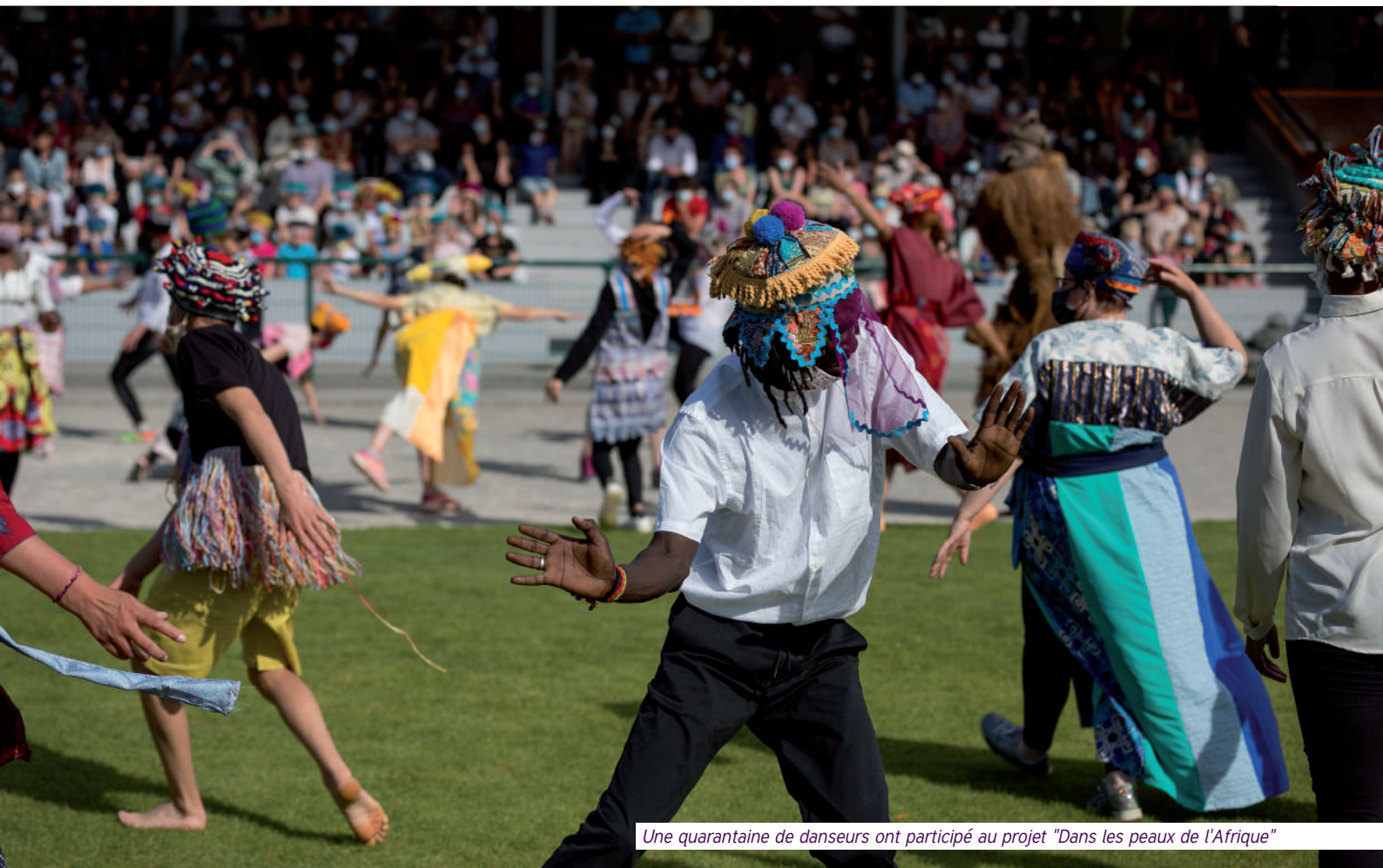
Une quarantaine de danseurs ont participé au projet "Dans les peaux de l'Afrique"