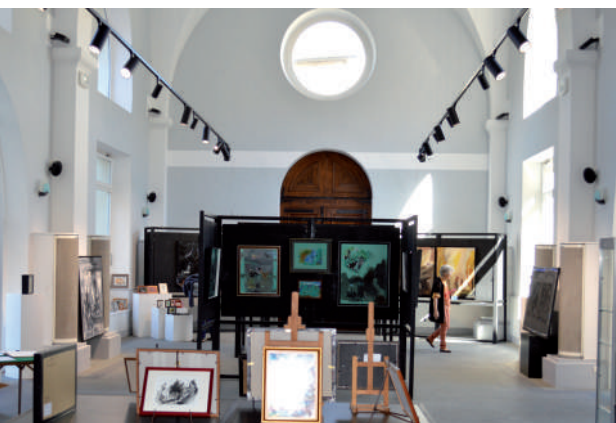
Salle d'exposition de l'espace Saint-Laurent