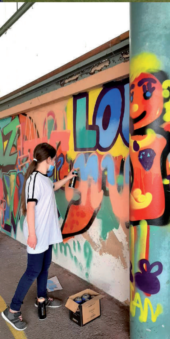
Atelier graff à l'école du Centre