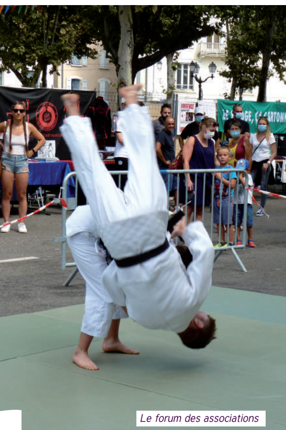
Le forum des associations