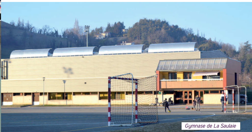
Gymnase de La Saulaie