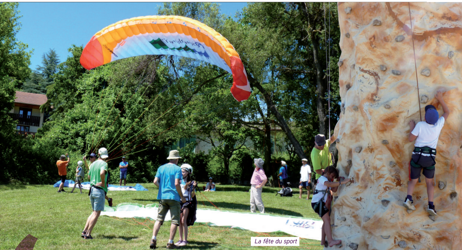
La fête du sport