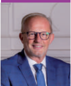
Maire de Saint-Marcellin

Nous déployons un programme d'investissement ambitieux pour faire de Saint-Marcellin, une ville attractive où il fait bon vivre. L'année 2022 sera placée sous le signe de l'action et de la concrétisation de grandes opérations urbaines comme par exemple sur le champ de Mars. La commune va également engager le programme d'aménagement de l'avenue et du parking de La Saulaie. Nous poursuivons, grâce à l'Opah-RU, l'aide apportée aux propriétaires pour la rénovation de leur logement. Notre plan pluriannuel d'investissement de plus de 4 millions d'euros par an va nous permettre de changer le visage de Saint-Marcellin.