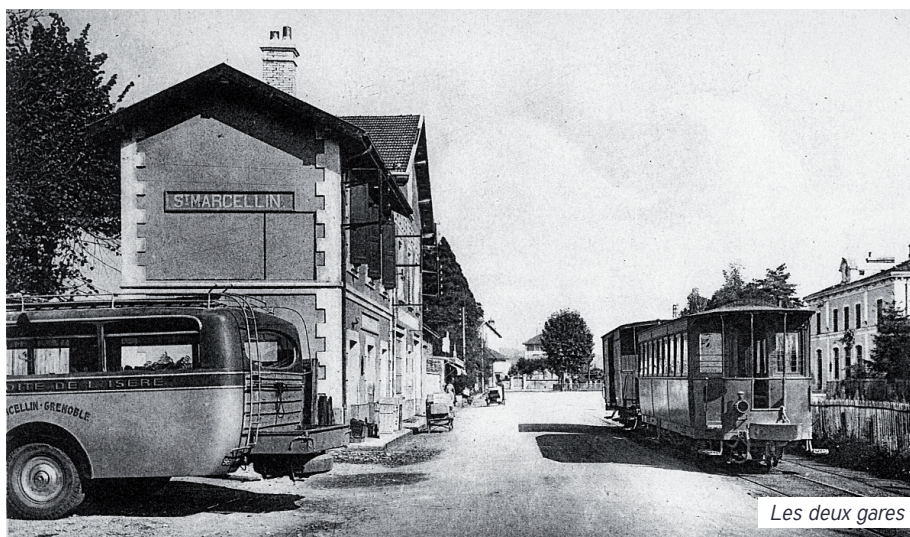
Les deux gares

Le quartier de la Gare va dans les années à venir connaître de profonds changements. Retour sur l'histoire de ce quartier.