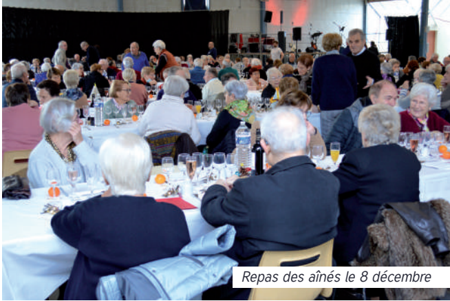
Repas des aînés le 8 décembre

À l'occasion des fêtes de Noël, le CCAS a offert aux aînés de plus de 70 ans, soit un repas, soit un colis, soit nouveauté en 2022 un chèque Cœur du commerce. Le repas s'est déroulé le 8 décembre au Forum et le retrait des colis les 5 et 6 décembre.