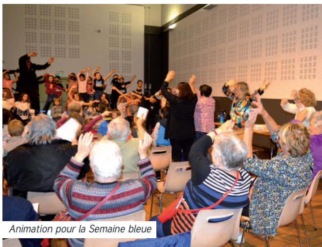
Animation pour la Semaine bleue

Un travail sur l'amélioration des conditions de travail des aides à domicile est actuellement mené.