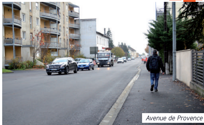
Avenue de Provence

Les travaux avenue de Provence, fréquentée par 18 000 véhicules par jour sont en cours d'achèvement. Cette voie a été entièrement réaménagée : reprise de l'enrobé par le Département de l'Isère, aménagements améliorant les cheminements cycles et piétons, reprise par la ville des trottoirs entre le rond-point de l'Europe et la rue D'Arsonval.