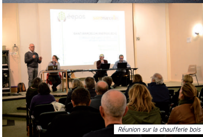
Réunion sur la chaufferie bois

Dans le cadre des travaux d'aménagement du champ de Mars, l'Institut national de recherche archéologique préventive (INRAP) a réalisé des diagnostics archéologiques en novembre-décembre 2022. D'autres fouilles se dérouleront à partir du 20 février, avenue du Collège et place d'Armes.