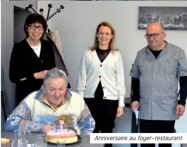
Anniversaire au foyer-restaurant