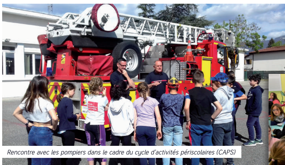
Rencontre avec les pompiers dans le cadre du cycle d'activités périscolaires (CAPS)